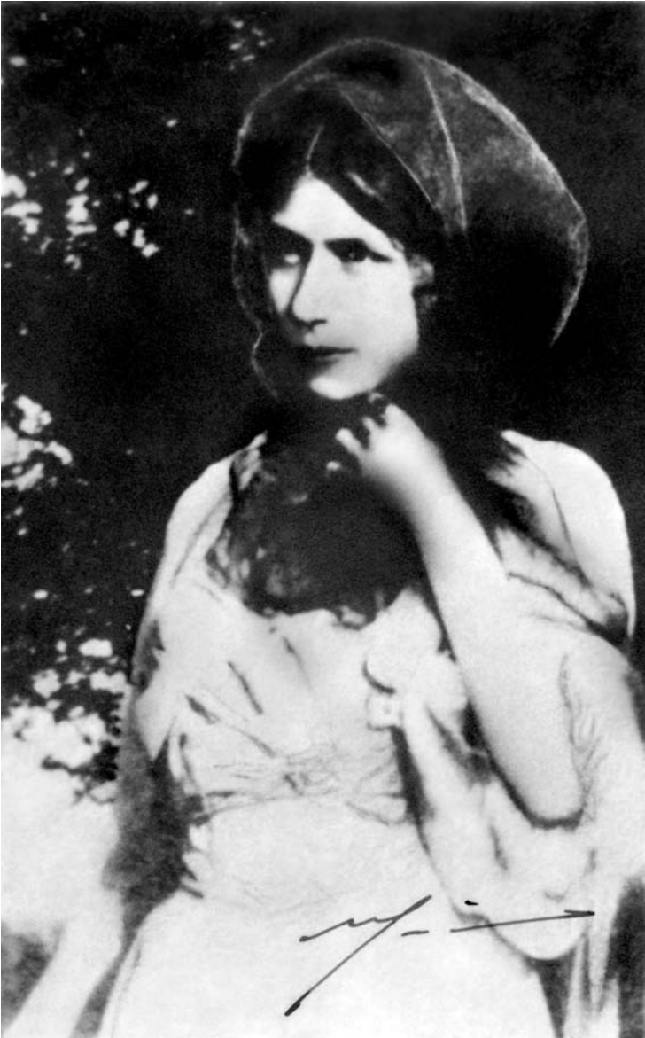
La Mère en Algérie, 1903-05