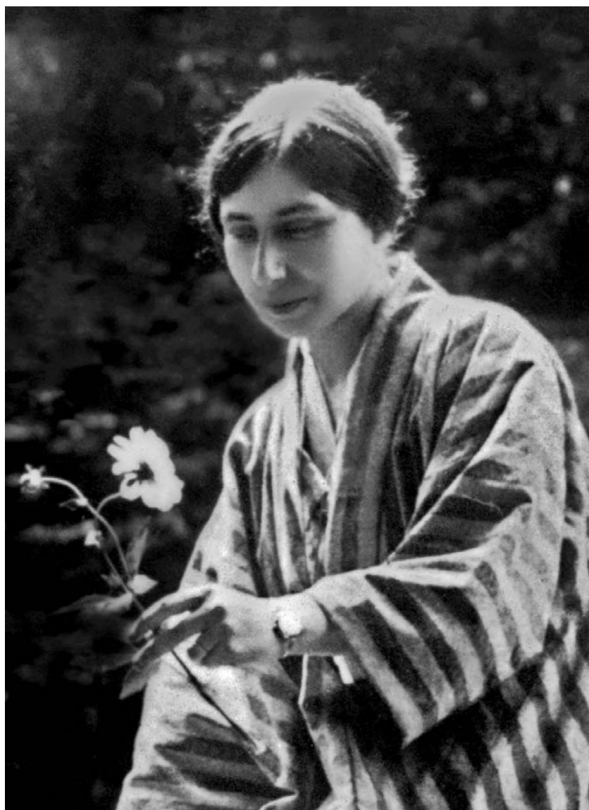
La Mère à Tokyo en 1916