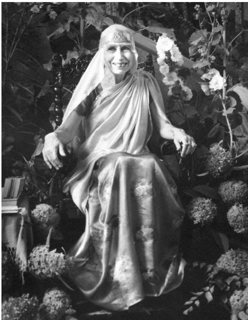
La Mère en 1954