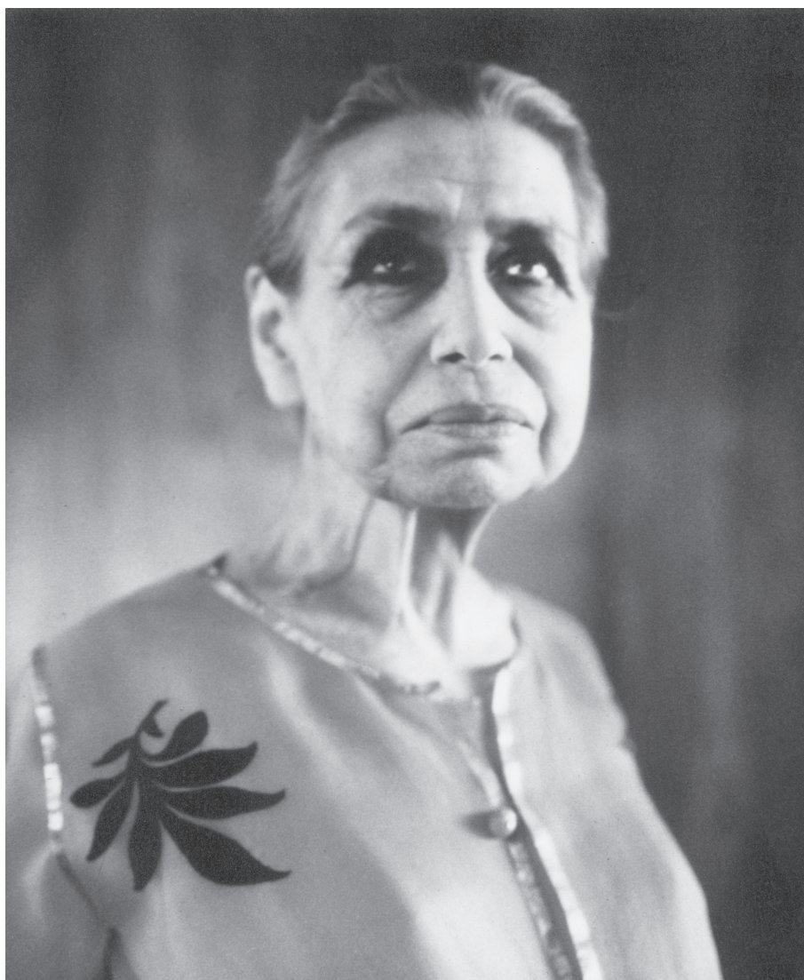
La Mère en 1960