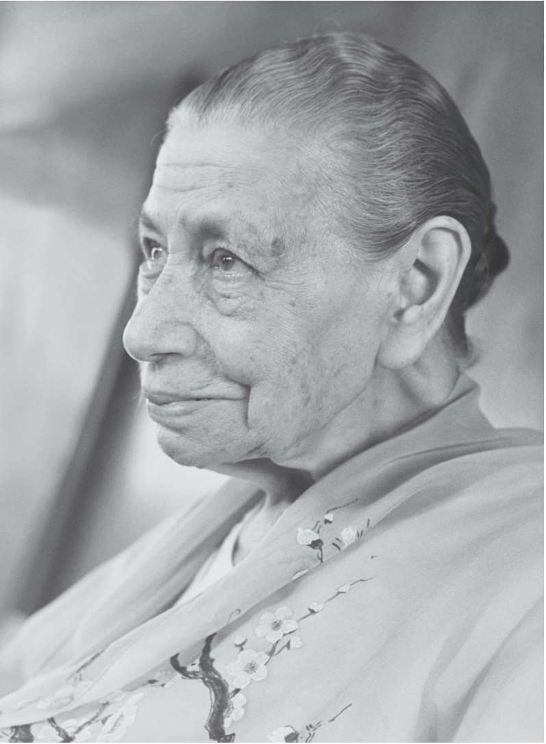
La Mère en 1969