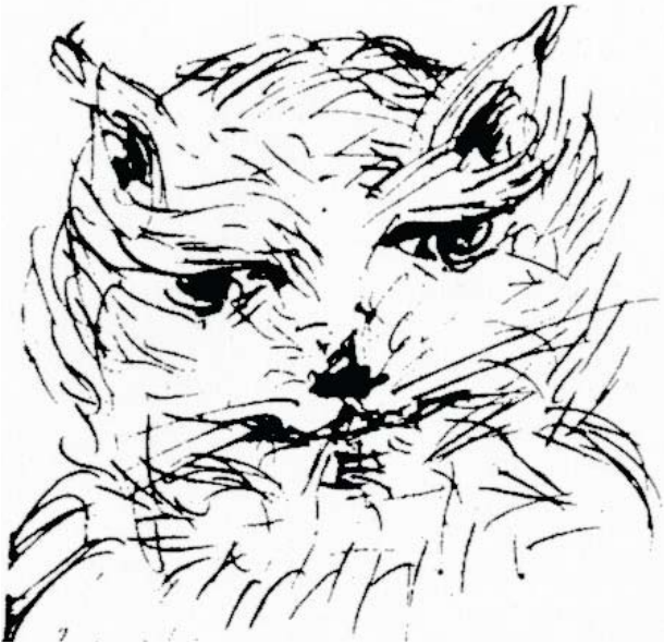
Chat heureux dessiné par la Mère pour remonter le moral à son disciple malheureux