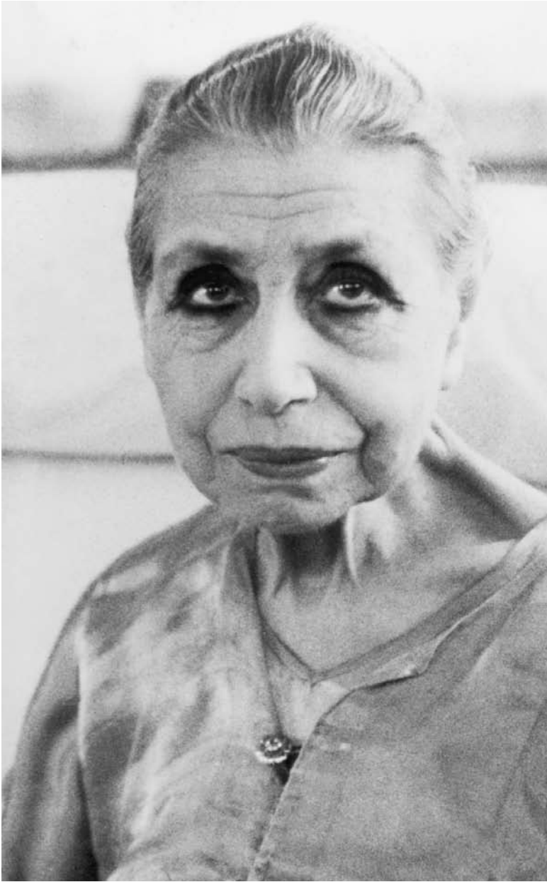
La Mère en 1960